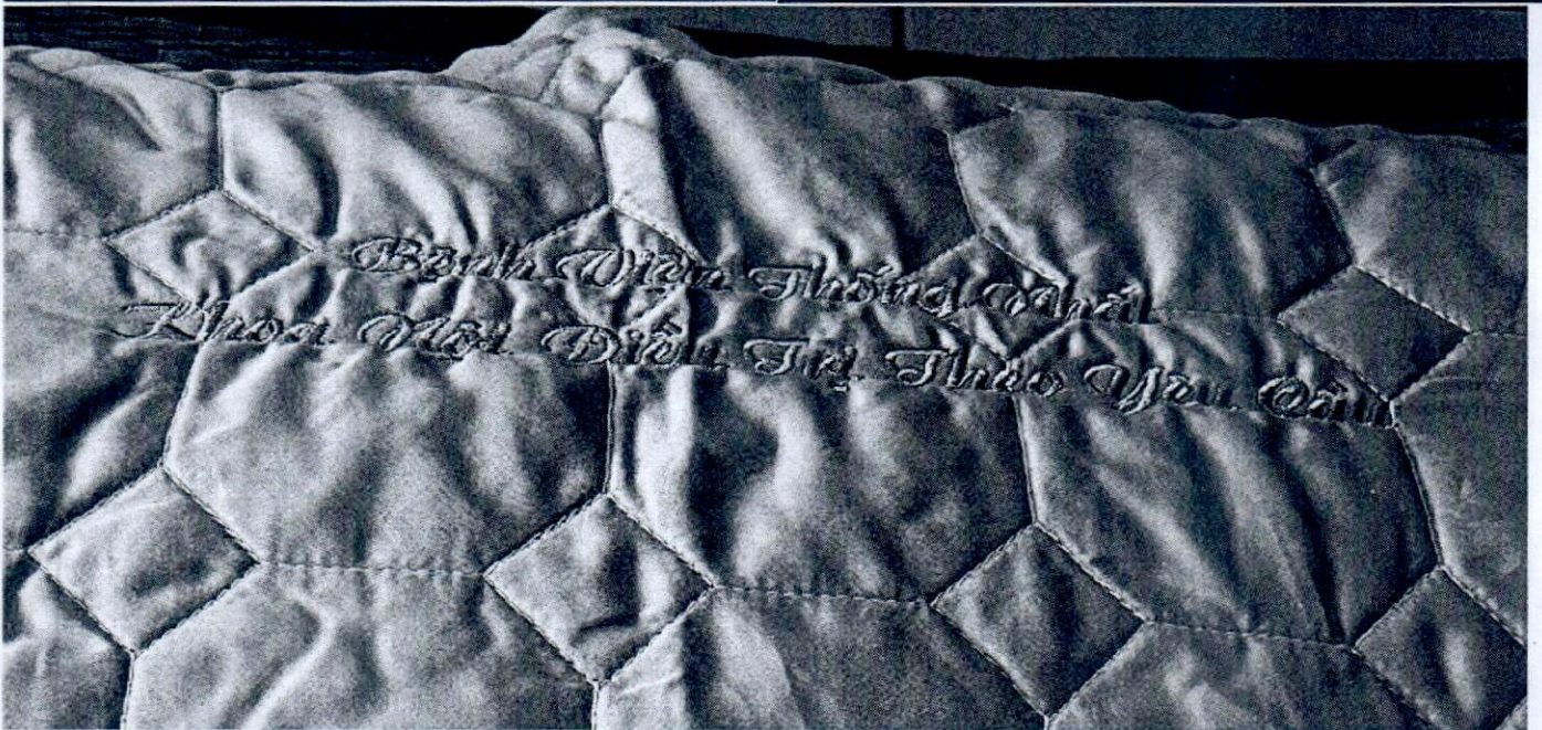
Mẫu tham khảo tại khoa