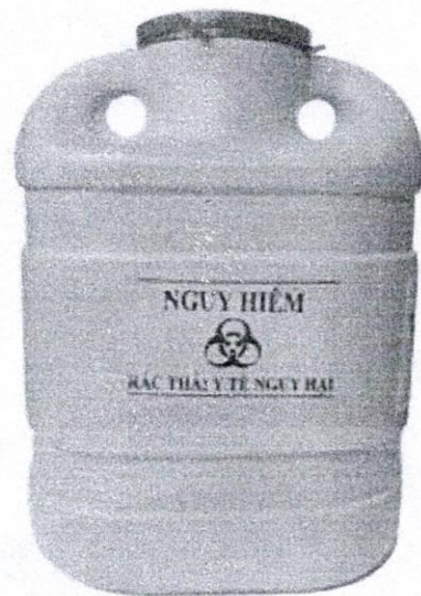
Hộp dung tích 6,8 lít